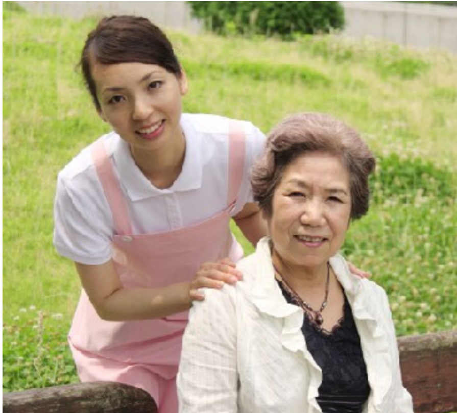
配偶者が亡くなっても今までどおり、我が家に住み続けることができます